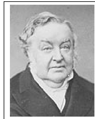
Johann Christoph Blumhardt d.Ä.

Schon 1850 hatte Blumhardt zwei Einladungen zu Missionsfesten: Eine nach Karlsruhe und eine nach Hassloch. Die Feste fielen auf den gleichen Tag. So musste sich Blumhardt entscheiden: An einen Freund schrieb er, er habe „den Pfälzern lieber gedient als den Carlsruhern“. Im Rückblick schreibt er: „In Hasloch waren Gnadenwerke sichtbar, die der Herr längst angeregt hatte.“ (In Hasloch waren etwa zur gleichen Zeit wie in Rockhausen die ersten Weisenhäuser der inneren Mission entstanden)